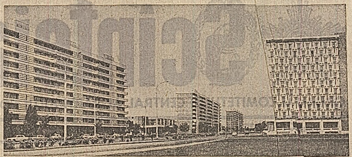
Din noua arhitectură a oraşului Galaţi