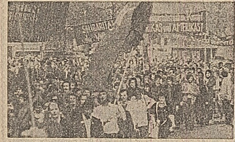
În Berlin occidental, mii de manifestanți protestind împotriva noulor măsuri ale S.U.A. de escaladare a războiului din Vietnam

In R.F.G. Peste 2.000 de studenți vest-germani au demonstrat joia pe străzile orașului Frankfurt pe Main, în semn de protest împotriva războiului din Vietnam. Demonstranții au împins manifeste prin care cer populației să-și exprime solidaritatea cu lupta popoarelor din Indochina. Unii studenți au organizat în aceeași zi, a avut loc în orașul universitar Erlburg.