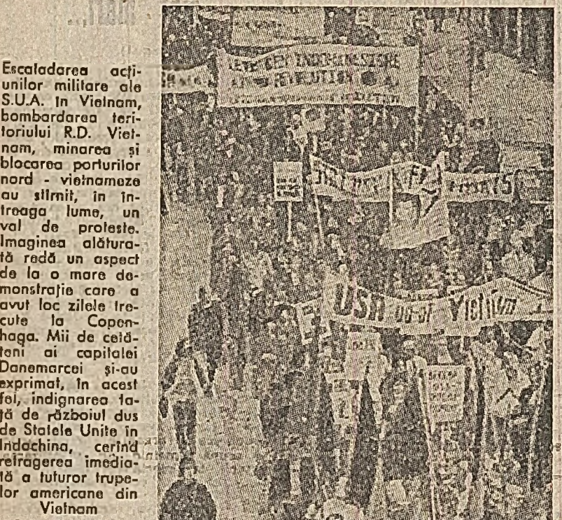
Escaladarea acțiunilor militare ale S.U.A. în Vietnam, bombardarea teritoriului R.D. Vietnam, minarea și blocarea porturilor nord-vietnameze sau sfârșit, în înfrângere lume, un val de proteste. Imaginarea căldurată a popoarelor rădă un aspect de demonstrație care a avut loc zilele trecute la Copenhaga. Mii de cetățeni ai capitalei Danemarcei și-au exprimat, în această zi, indignarea față de războiul din Statele Unite în Indochina, cerind retragerea imediată a tuturor trupelor americane din Vietnam.