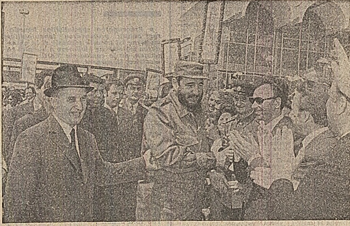
Tovarășul Fidel Castro Ruz stringe mîinile celor ce l-au întâmpinat, adresîndu-i un bun venit în România frățească