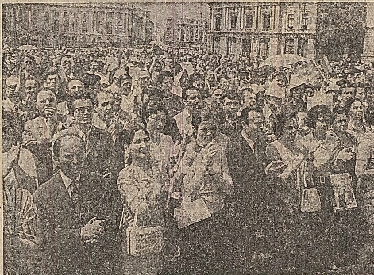
În Piața Republicii, mii de bucureșteni aplaudă cu căldură, ovacionează puternic pentru prietenia popoarelor române și cubaneze, pentru dezvoltarea ei în continuare, în interesul păcii, cauzei socialismului (fotografia din stînga). Din balconul sediului Comitetului Central al Partidului Comunist Român, tovarășul Fidel Castro Ruz transmite populației Capitalei un călduros salut revoluționar (fotografia din dreapta)

Convorbirile s-au desfășurat într-o atmosferă de căldură prietenească, de deplină înțelegere, stimă și respect reciproc.