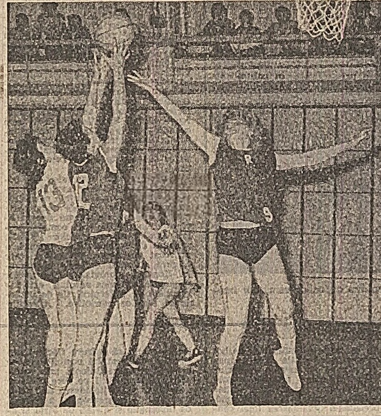
Luptă sub panoul rapidiştilor (fotă din meciul Rapid - Politehnica)