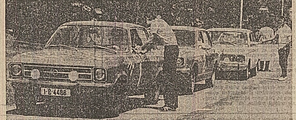
La ora cînd se încheie prima etapă a zărilor noastre, jurul raliului