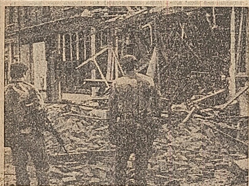
În fotografie: soldați britanici la locul unei recente explozii într-un carter al Belfastului.

U.R.S.S. și S.U.A. se apune în încheierea documentului, nu pretind că ele înseși și nu recunosc prezența altor state în problema securității sau avântului reciproc. U.R.S.S. și S.U.A. se apune în încheierea documentului, nu pretind că ele înseși și nu recunosc prezența altor state în problema securității sau avântului reciproc. U.R.S.S. și S.U.A. se apune în încheierea documentului, nu pretind că ele înseși și nu recunosc prezența altor state în problema securității sau avântului reciproc.