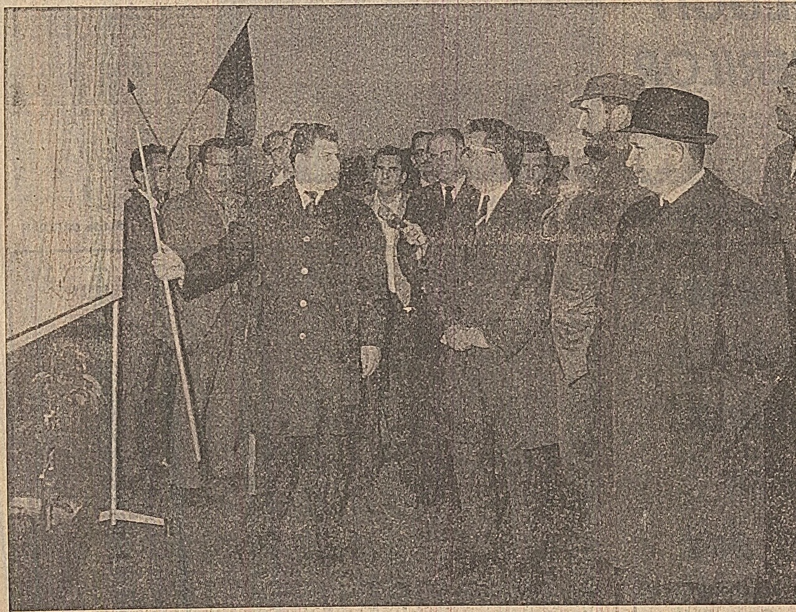
Popas la complexul de îngrijire a taurinelor Adunații Copăceni