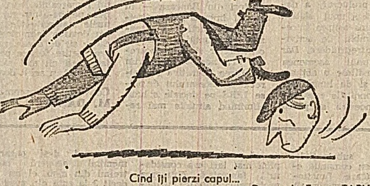
Cînd îți pierzi capul... Desen de Eugen TARU