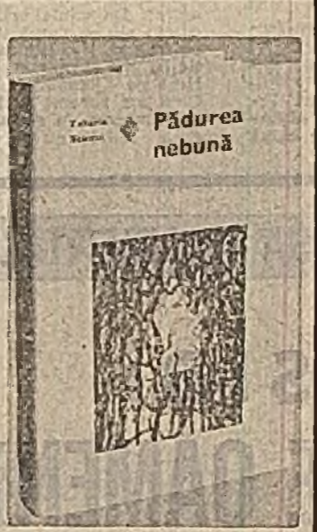
Dinno cărțile recent apărute sub egida editurii „Eminescu”...