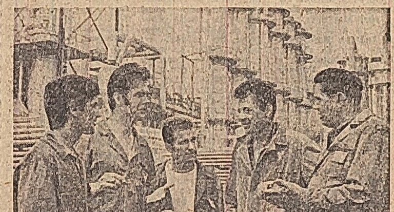
deplatarea si de valorificare a rezervelor, stimularea inițiativei colective si colaborarea dintre muncitorii acelorard...