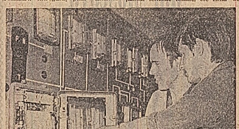
cu mult inainte de termen. Pina la ora aceasta s-au contractat 127 de masuri tehnice si organizatorice...