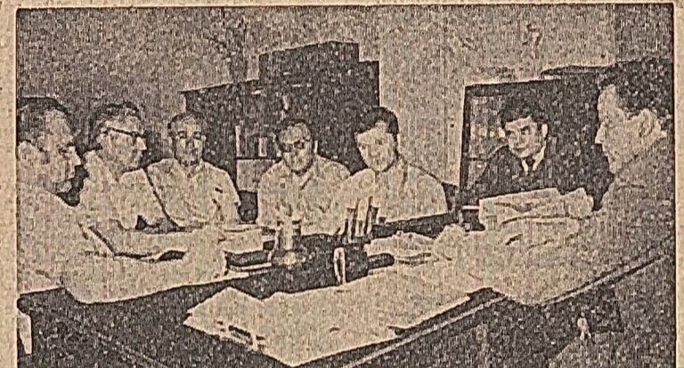
Dacă ne referim numai la cheltuielile materiale de producție, acestea vor atinge în 1974, potrivit calculului nostru...