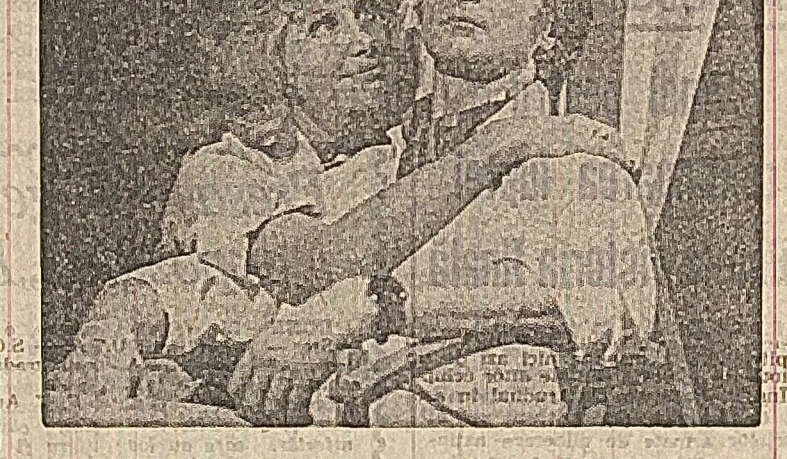
Actori ai Teatrului „Al. Davilla” din Pitești în timpul spectacolului „Jocul de-a vacanța”.

Primind cu o via simpatie de publicul local, trupa poloneză a