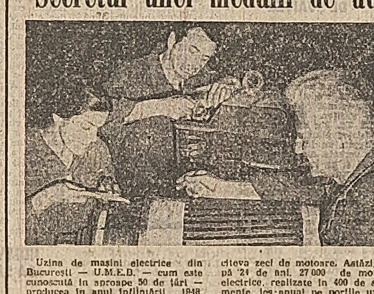
Uzina de mașini electrice din București — U.M.E.B. — cum este cunoscută în aproape 90 de țări, producea în anul înfățișării, 1948, câteva zeci de motoare. Astăzi, după 24 de ani, 27.000 de motoare electrice, realizate în 600 de sortimente, ies anual pe porțile uzinei.