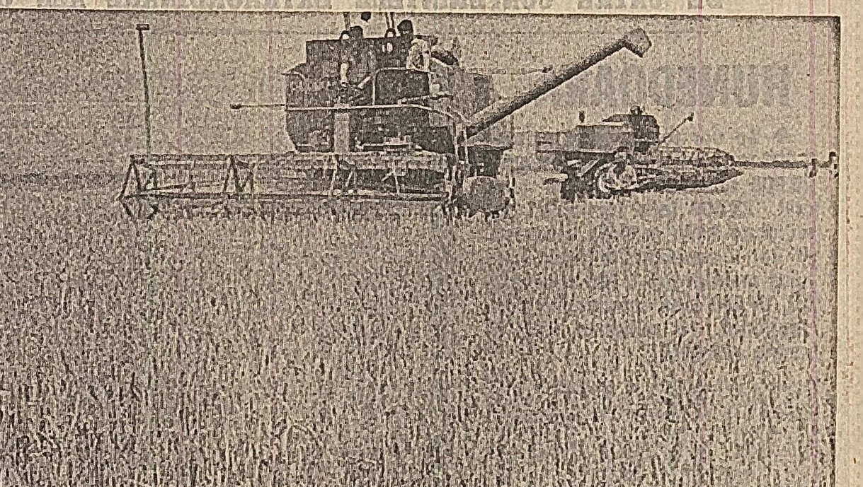
Evoluția coacerii grîului este urmărită cu atenție de către specialiștii Întreprinderii agricole de stat Zimnicea, județul Teleorman. Încă pe data de 21 iunie s-a dat semnalul începerii recoltării pe cele 780 ha cultivate cu grîu, lucrare care acum se desfășoară din plin.