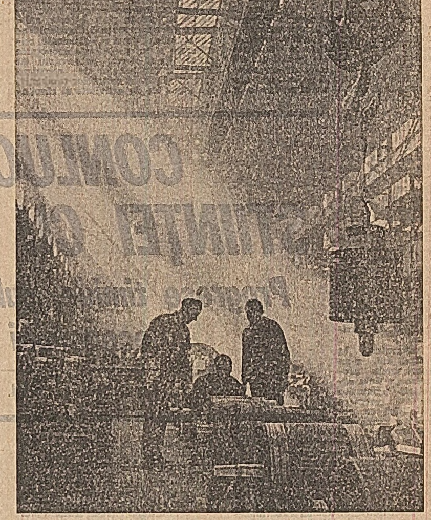
La uzina „Electropulere” din Croiova, muncitorii, cadrele tehnice caută mereu noi soluții pentru perfecționarea producției, pentru raționalizarea consumurilor de materii prime și materiale, în vederea realizării angajamentelor asumate în întrecere. În fotografie: aspect dintr-una din secțiile uzinei

Comunistii, toți oamenii muncii din uzina de mașini agricole din Covasna și-au îndeplinit cu succes planul de producție.