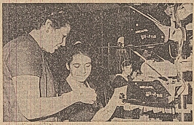
Pe primul semestru, harnicul colectiv al întreprinderii „Electroaparataj-București” a obținut un spor, față de plan, la producția mării de țesături și a muncii limitate substanțiale a coeficientului de schimburi și creșterii productivității muncii.

Directorul general al centralei apreciază că se mai poate vorbi încă de o tulpă măruntă din partea ministrului. Actuala stare de lucruri, când centralele nu au dreptul să hotărască în unele probleme (cum este cazul completării rețelei de servicii cu un om) aduce mari prejudicii nu numai uzinelor, ci chiar și economiei.