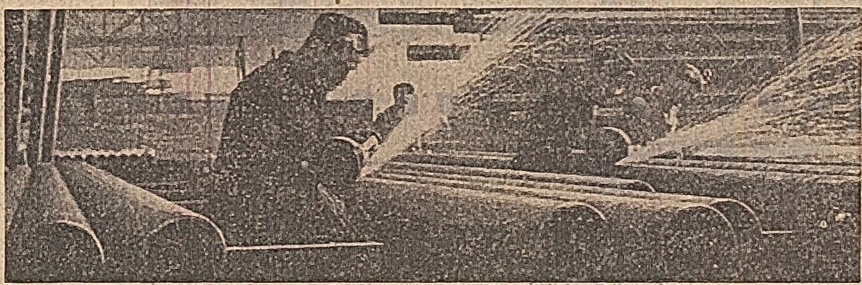
Uzina „Republica” din Capitală, secția de finisare exterioră a jvilor la laminorul de 6 loli