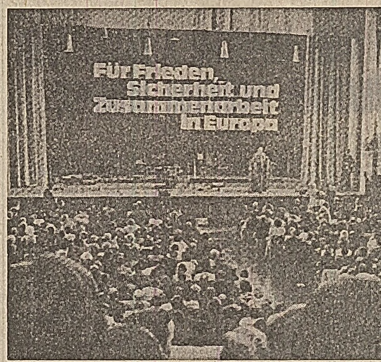
Sub lozincă „Pentru pace, securitate și colaborare în Europa”, la Mannheim (R.F.G.) a avut loc o adunare populară, în sprijinul convocării din mai grabnică a conferinței general-europene pentru securitate

Lucrările simpozionului au fost deschise de Masayoshi Oka, vicepreședintele al Prezidiului C.C. al P.C. din Japonia, care a rostit o cuvântare de salut.