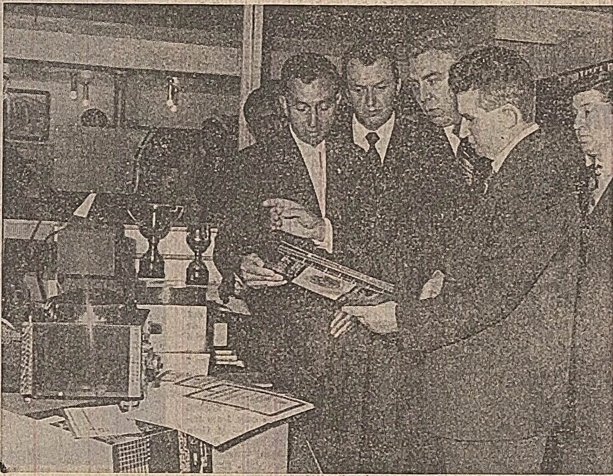
În timpul vizitării standurilor cu exponate vîndînd preocupările şi realizările elevilor şi cadrelor didactice din liceele de specialitate, secretarul general abordează şi aici un întreg complex de probleme privind profilul şi structura actuală a acestor unităţi şcolare, apreciind că în prezent există o adevărată familiaritate a profesorilor la realizarea unor produse necesare altor economii naţionale, cât şi exportului, directorul şcolii putînd fi considerat un adevărat director de fabrică. Sigur, acesta implică mutarea centrului de preocupări spre activitatea direct productivă, elevii urmînd să dobîndească polivalenţa de specialitate, muncind pe schimburi, nu în sălile de clasă, ci în halele uzinelor, pe ogoare, în laboratoarele chimiei sau în alte locuri, potrivit specialităţii spre care tînd. Cursurile teoretice să se facă de preferinţă după-amiaza sau seara. În ce priveşte programul de învăţămînt, el trebuie să ofere noţiuni temeinice de matematică, de fizică, de tehnologia materialelor, în aşa fel încît elevii să aibă un profil mai complex şi mai larg decît cel de licee de cultură generală, astfel încît în absenţa culturii generale să fie pregătiţi în unele specialităţi care în prezent sînt specifice doar liceelor tehnice. Acest-

Apreciind realizările obţinute în şcolile profesionale şi în liceele de cultură generală ca un început al procesului complex de legare strînsă a învăţămîntului de viaţă, de stăruirea producţiei materiale, tovarăşul Nicolae Ceauşescu subliniază, în cadrul discursurilor cu conducerea Ministerului Educaţiei şi Învăţămîntului, cu cadrele didactice şi specialiştii prezenti, necesitatea unei orientări ferme spre activitatea direct productivă menită să conducă la o pregătire temeinică, de specialitate a tineretului. Indicaţiile secretariatului general vizează însăşi structura actuală a învăţămîntului de toate gradele, ja-bonind direcţii precise şi clare care să schimbe raportul existent azi. Într-o şcoală profesională, cea de cultură generală şi liceele de specialitate. Ponderea pregătirii elevilor şcolilor profesionale trebuie să o aibă lucrul nemijlocit în atelierele fabricilor şi uzinelor, sub îndrumarea celor mai buni muncitori şi maistri, pentru a se califica în meseria aleasă, urmînd ca studiul teoretic şi cultura generală să aibă în sfîrşit, în cadrul oricărui nivel de învăţămînt, rolul de 10 ani, absolvîndu-se astfel în industrie, în agricultură, în a-