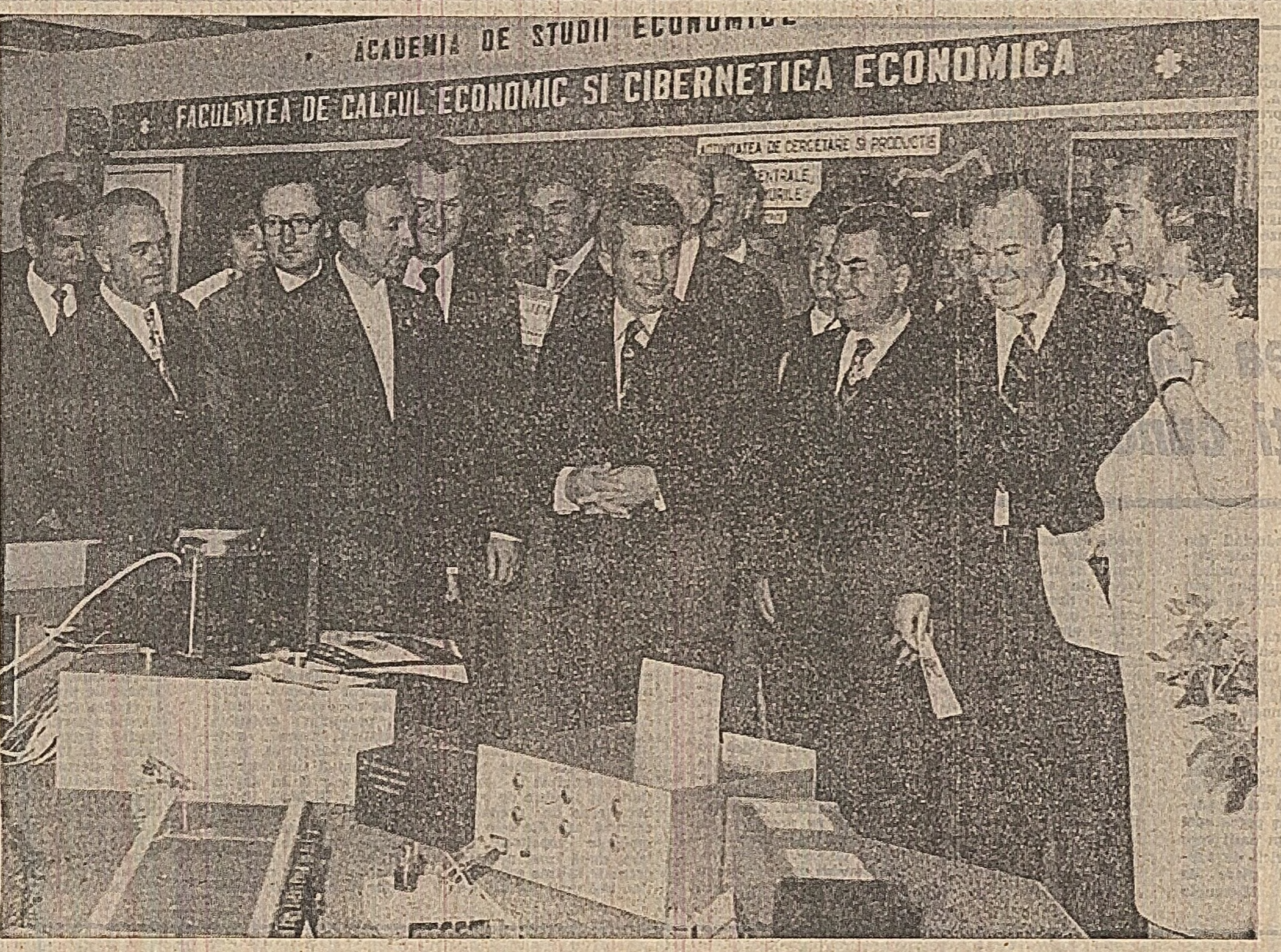
În timpul vizitării standurilor cu exponate vîndînd preocupările şi realizările elevilor şi cadrelor didactice din liceele de specialitate, secretarul general abordează şi aici un întreg complex de probleme privind profilul şi structura actuală a acestor unităţi şcolare, apreciind că în prezent există o adevărată familiaritate a profesorilor la realizarea unor produse necesare altor economii naţionale, cât şi exportului, directorul şcolii putînd fi considerat un adevărat director de fabrică. Sigur, acesta implică mutarea centrului de preocupări spre activitatea direct productivă, elevii urmînd să dobîndească polivalenţa de specialitate, muncind pe schimburi, nu în sălile de clasă, ci în halele uzinelor, pe ogoare, în laboratoarele chimiei sau în alte locuri, potrivit specialităţii spre care tînd. Cursurile teoretice să se facă de preferinţă după-amiaza sau seara. În ce priveşte programul de învăţămînt, el trebuie să ofere noţiuni temeinice de matematică, de fizică, de tehnologia materialelor, în aşa fel încît elevii să aibă un profil mai complex şi mai larg decît cel de licee de cultură generală, astfel încît în absenţa culturii generale să fie pregătiţi în unele specialităţi care în prezent sînt specifice doar liceelor tehnice. Acest-

Prin Decret al Consiliului de Stat au mai fost conferite 240 ordine şi 490 medali unor cadre didactice din învăţămîntul de toate gradele, care au desfăşurat o activitate meritorie în domeniul instruirii şi educării elevilor şi studenţilor.