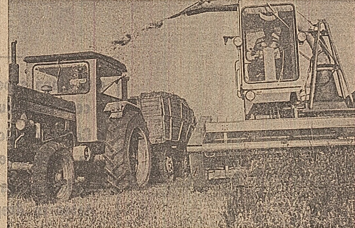
Recoltatul lucernei, cu ajutorul combinei, la ferma nr. 7 a I.A.S. Băilești, județul Dolj