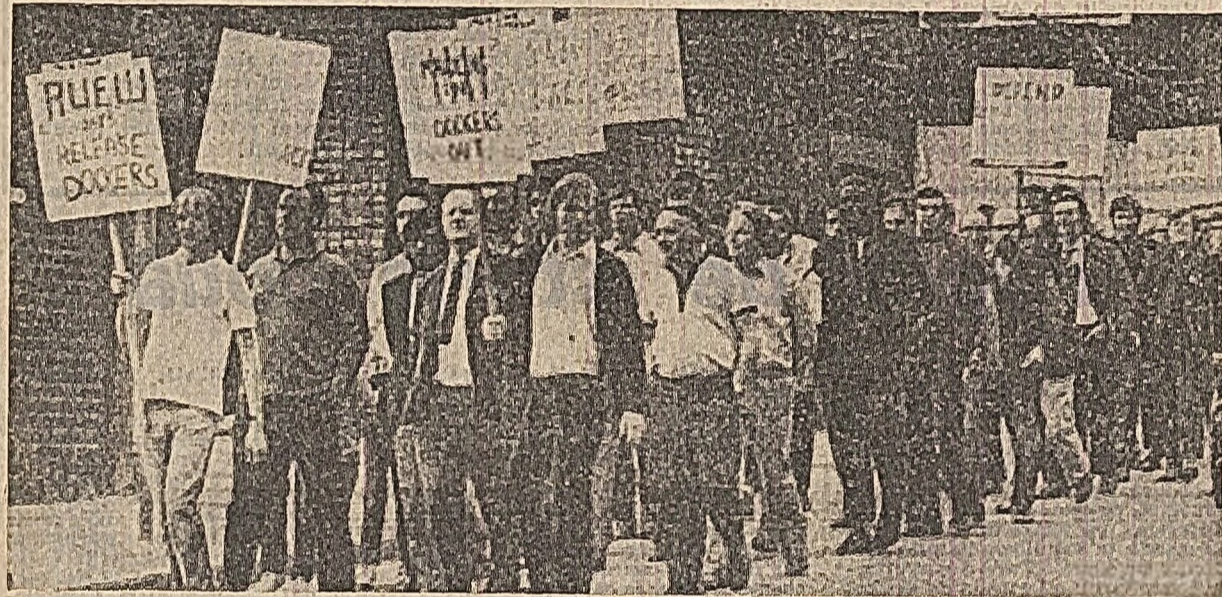
În jurul închisorii Pentonville, unde au fost închiși cei cinci docheri, patrulază grupuri de muncitori care cer eliberarea imediată a acestora și abrogarea legii antiunionarilor.

Tipografil, muncitorii din transporturi rutiere, minerii din Tara Galilor, Scoția și Yorkshire, vizitatorii din halele Londrei au înscris, la rândul lor, lucrul, susținând cauza docherilor și cerind suspendarea legii Carr — lege antiunionară care reglementează relațiile în industrie. Dimensiunile conflictului s-au amplificat și mai mult odată cu esecul negocierilor care au avut loc, luni seara, între președintele Edward Heath și liderii Congresului Sindicatelor Britanice (T.U.C.). Un comunicat oficial, dat publicității în sfârșitul convorbirilor, afirmă că „nu vom admite suspendarea legii Carr, dar că acceptăm să discutăm cu sindicatele în vederea modificării ei”. La rândul său, Victor Feather, secretarul general al T.U.C., a declarat, după întâlnirea cu președintele Heath, că sindicatele nu vor accepta nici o soluție propusă de guvern înainte de eliberarea docherilor areștați. Miercuri, Consiliul Executiv al T.U.C. se va reuni pentru a lua în discuție propunerea avansată de mai mult unii sindacaliști afiliați, privind declanșarea unei greve generale, la nivel național.