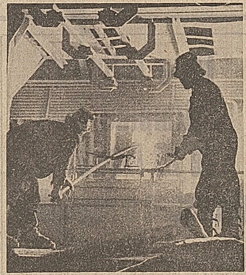
Muncă insuflețită în sectoarele „calde” ale Combinatului chimic din Timișoara

Citiți, în pagina a II-a, știri de la corespondenții noștri despre înfăptuiri prin care oamenii muncii cinstesc marea sărbătoare