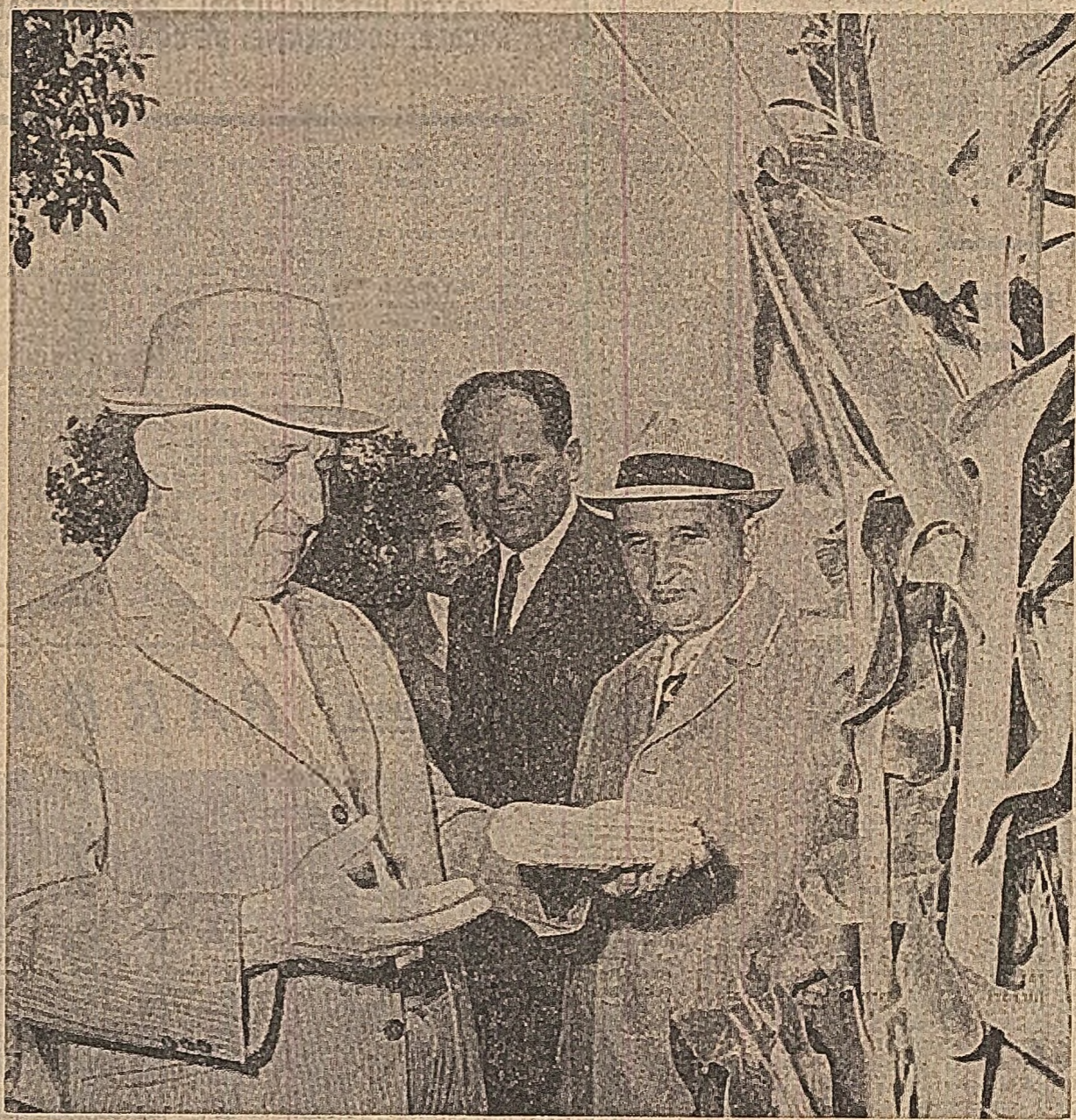
În lanul de porumb irigat de la stațiunea Valul lui Traian

Conducătorii de partid și de stat al României și Bulgariei sint înfăptuiri cu această căldură ca pe întreg parcursul vizitei. Pe fațada clădirii de la intrare se aflau portretele tovarășilor Nicolae Ceaușescu și Todor Jivkov, încadrate de urarea: „Trăiască prietenia româno-bulgară”.