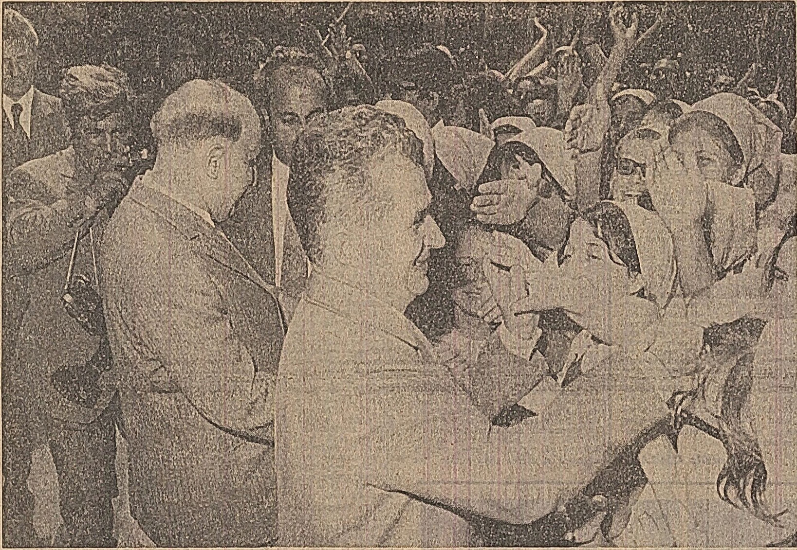
Prețutindeni, oaspeții sînt întîmpinați cu căldură

Tovarășii Nicolae Ceaușescu și Todor Jivkov au făcut, în cursul dimineții de ieri, o vizită la unele obiective industriale, agricole și de cercetare din județul Constanța.