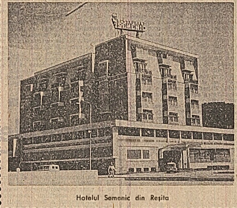
Hotelul Semonic din Reșița