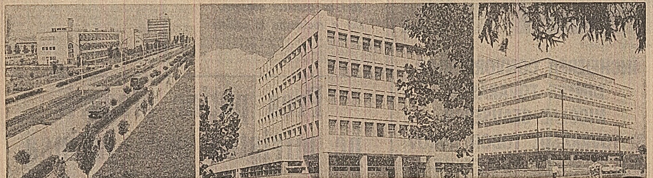
Imagini din Iași: zona industrială a orașului se îmbogățește cu fiecare an prin darea în folosință a noi unități ale economiei noastre socialiste. Construcțiile porturile sînt numai cîteva din ramurile ce și-au pus amprenta pe noul peisaj economic al orașului (foto 1); știința și tehnica sînt și ele prezente aici prin impunătorul centru de calcul electronic dat de curînd în folosință (foto 2); un nou magazin universal deschide perspectiva largă a pieței centrale, încadrînd-se armonios în splendidul peisaj arhitectonic ieșean (foto 3)

Realizarea unei organizații superioare a circulației mărfurilor, care să asigure deservirea unui comerț modern, cu eficiență sporită, este o sarcină de mare importanță pe care conducerea partidului a pus-o în fața organizațiilor noastre. Într-o asemenea măsură întreprinse în județul nostru. Încă din 1967, la Cluj funcționează întreprinderi integrate de subordonare locală pentru comerțul alimentar și cu produse metalo-chimice. În loc de 11 organizații comerciale locale cu amănuntul și 3 cu ridicata, cîte erau mai înainte, acum există numai 3 întreprinderi integrate pentru comerțul alimentar în Cluj, Turda și Dej și una pentru sectorul de metalo-chimice, care organizează desfacerea cu amănuntul în municipiul Cluj și cu ridicata în județele Cluj, Alba, Bistrița-Năsăud și Sălaj.