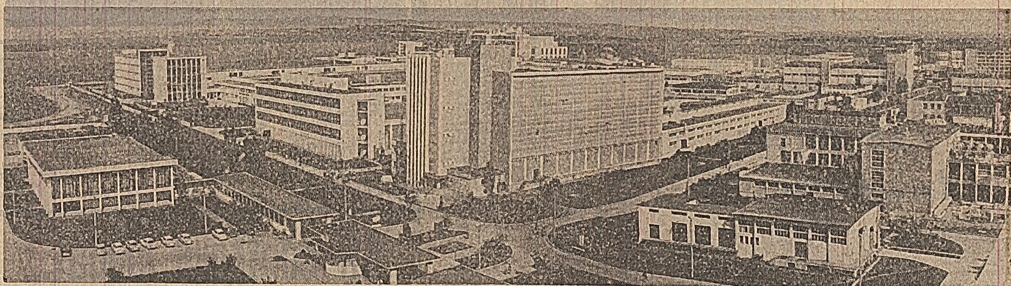
Aici, la Uzina de fibre sintetice din Săvinești, sînt produse firele țesute în stofa îmbrăcămintei și în blînderile sintetice.