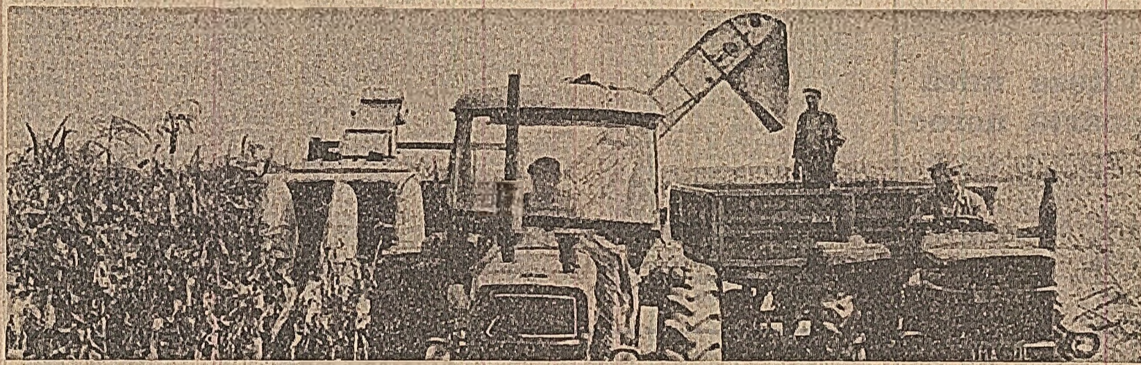
Recoltatul porumbului la cooperativa agricolă Ulmeni, județul Ilfov