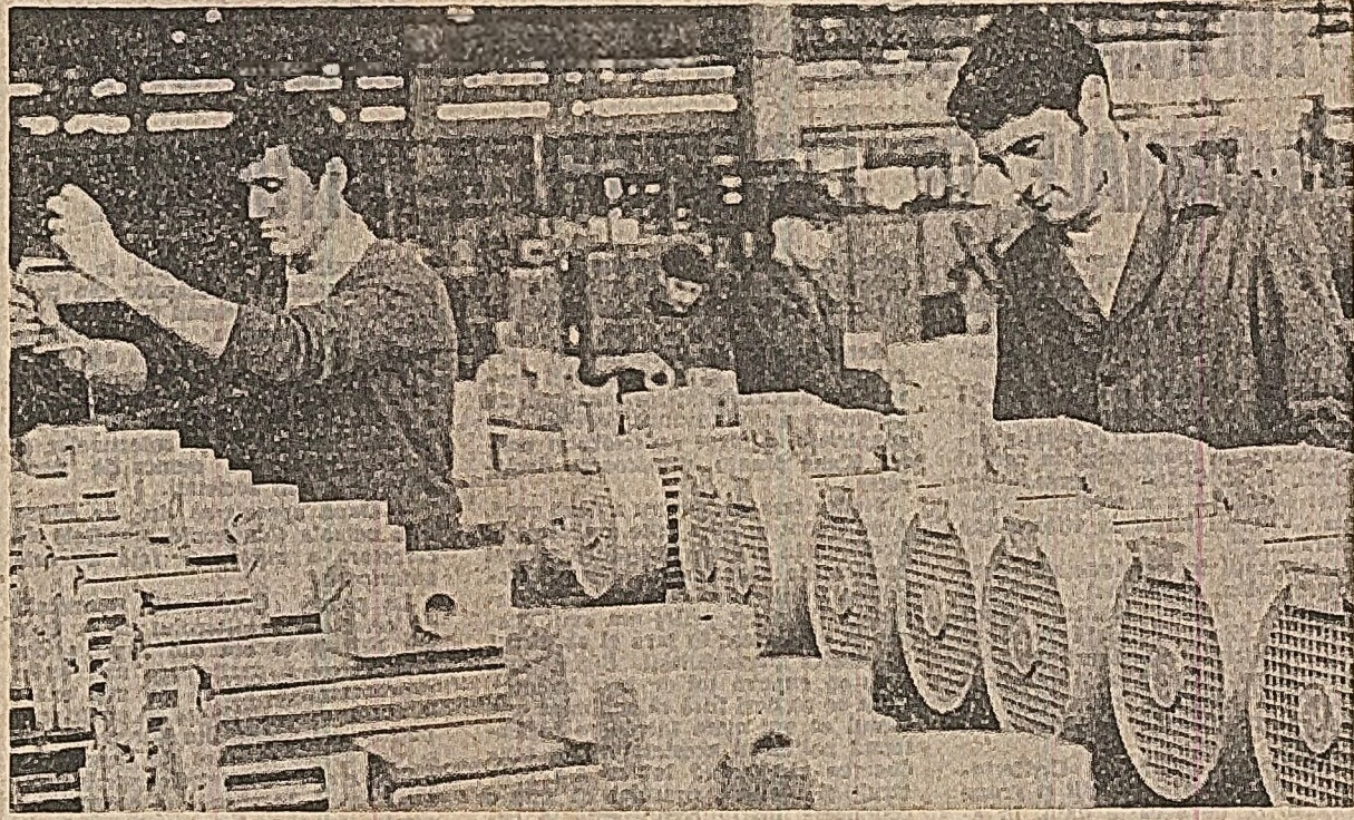
Produsele obținute la Fabrica de motoare electrice din Pitești sînt tot mai mult cunoscute pentru calitatea superioară a execuției. Iată o imagine din secția de motoare asincrone