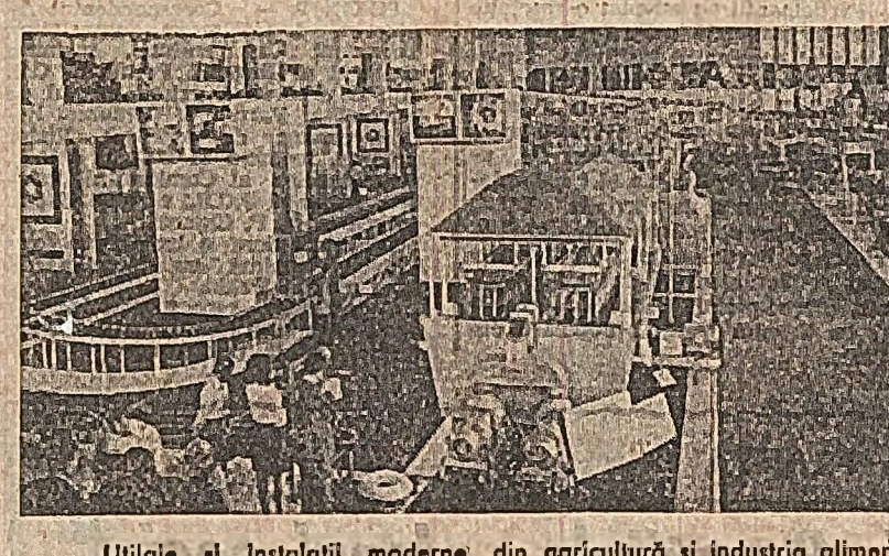
Ufficii și instalații moderne din agricultură și industria alimentară...