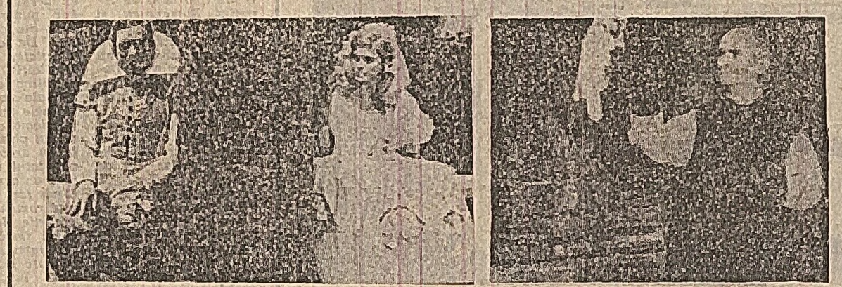
Coproducție franco-italo-hispano-vest-germană. Regia: Gérard Oury. Aventuri eroi-comice într-un decor de epocă.

PREZINTĂ PE LOUIS DE FUNÈS ȘI YVES MONTAND ÎN FILMUL „MANIA GRANDORII”