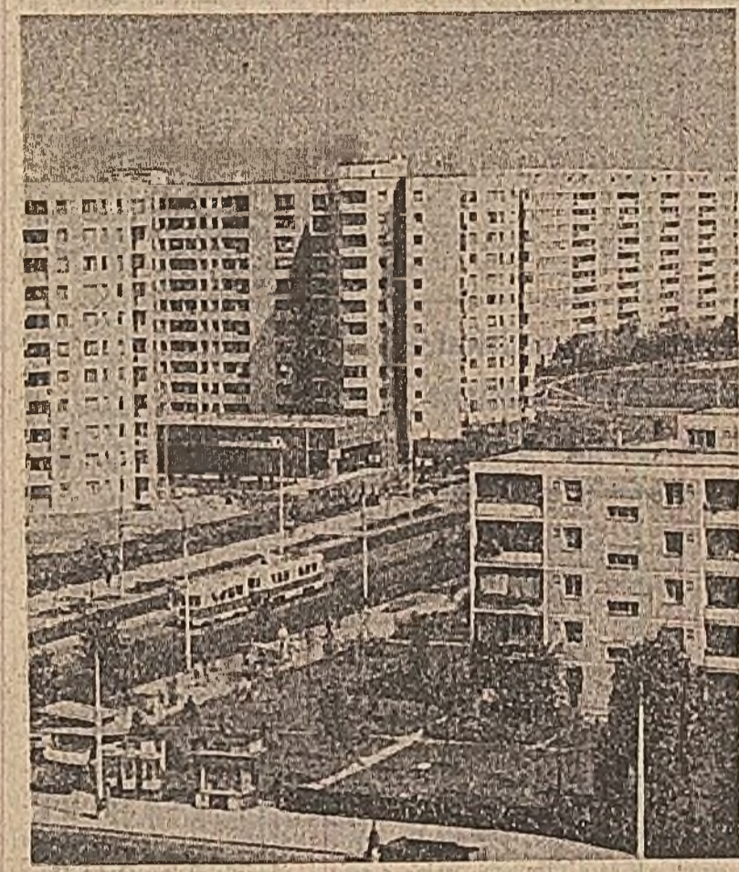
Unul din edificiile cele mai cunoscute din acest adevărat „oraș în oraș”, care este cartierul Balta Albă din Capitală: noul magazin Big.