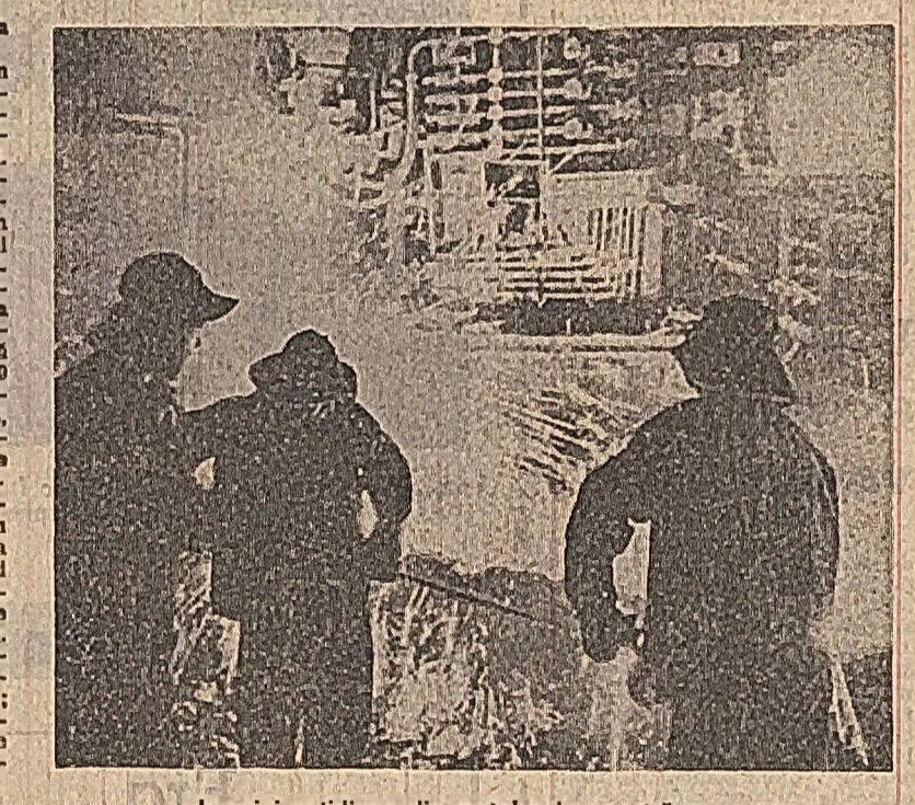
Imagini cotidiene din metalurgia noastră.

Începînd din acest an, în fiecare a treia duminică a lunii septembrie, se va sărbători „Ziua metalurgistului”. Este un cald omagiu adus acestui harnic detașament al clasei noastre muncitoare, angajat cu toată forța în marșul întrecere socială pentru îndeplinirea cincinalului înainte de termen, pentru traduceră în viață al hotărîrilor recente ale Conferinței Naționale a partidului. În țara noastră, metalurgia are o tradiție îndelungată, dar numai în anii construcției socialiste a cunoscut adevărată înflorire, devenind — ca urmare a politicii consecvente a partidului de industrializare socialistă — ramură cheie a progresului rapid și multilateral al întregii economii naționale. Fondurile de investiții alocate metalurgiei au sporit de la un cincinal la altul, construindu-se noi și moderne unități industriale — In Coștaș, Combinatul siderurgic din Galați, uzina de țevi de la Roman și Iași, Uzina de aluminiu din Slătina ș.a. — modernizîndu-se și dezvoltîndu-se unitățile existente. Semnificativ este faptul că, în perioada 1959—1972, numărul unităților industriale metalurgice a dublat, numărul lucrătorilor din această ramură a crescut de aproape 5 ori, iar gradul de înze-