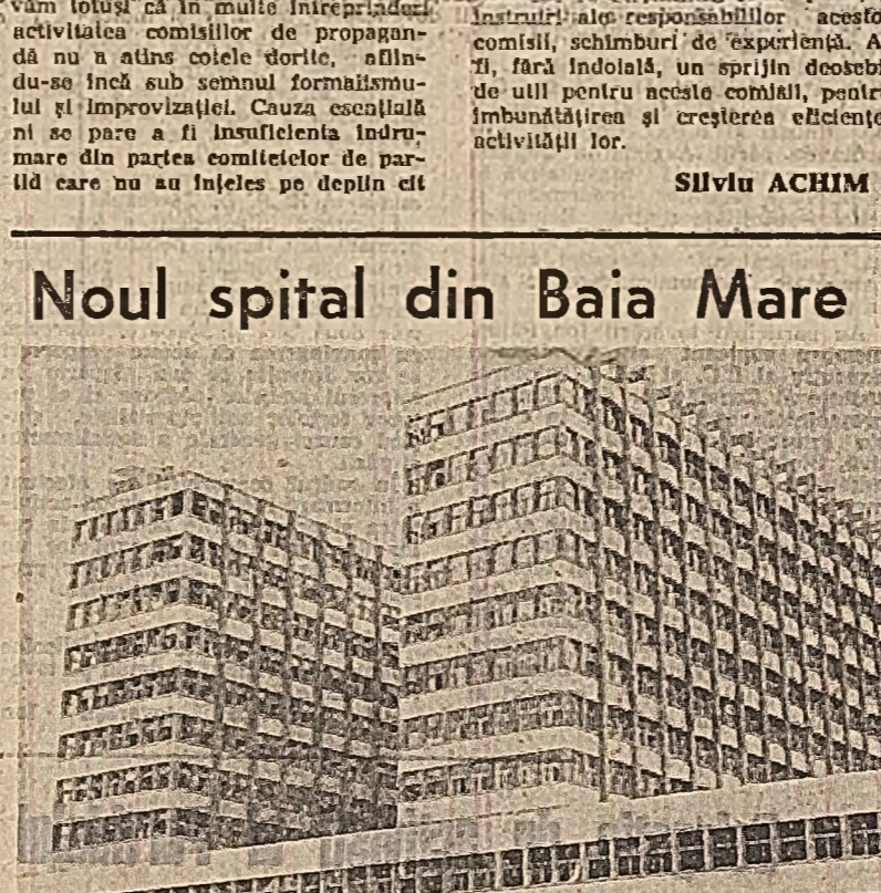
Un impresionant număr de mari spitale moderne, dotate și peșore în acest caz, zăstrea materială pusă în slujba ocrotirii sănătății omului. În fotografie: noul spital din Baia Mare.