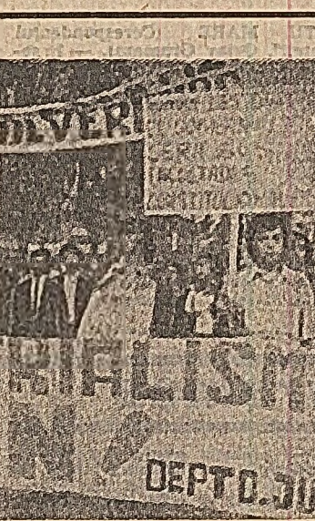
Santiago de Chile. Demonstrația muncitorească în sprijinul guvernului Unității Populare, împotriva unelrilor forțelor reacționari.

ROMA 27. — Corespondentul Agerpres, N. Pulcea, transmite: În cadrul lucrărilor celei de-a 60-a Conferințe anuale a Uniunii Interparlamentare, la 27 septembrie au început discuțiile pe comisi de studiu. S-au înținat comisiile pentru „problemele politice, ale securității internaționale și dezarmării”, pentru „educație, știință și cultură”, pentru „problemele economice și sociale”, precum și comisia pentru „scrierile ne autonome și studiul problemelor etnice”. Joi se încheie și comisia pentru „problemele parlamentare și juridice”. În discuțiile ce au loc cu acest prilej se definește textul rezoluțiilor ce vor fi adoptate, la 29 septembrie, votului și aprobării conferinței. Membrii delegației grupului parlamentar român au expus în cadrul dezbaterilor din diferite comisiile politice România asupra problemelor aflate în discuție.