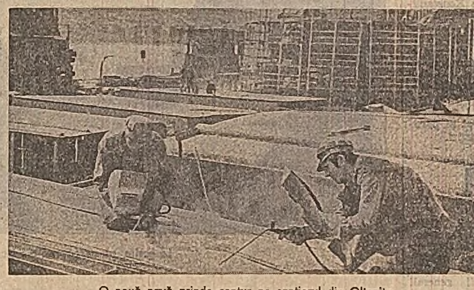
O nouă navă prinde contur pe șantiere din Oltenița.

— Da, s-a calculat. Pentru punerea în valoare a rezervelor producției, întreprinderea disciplină în muncă. Începînd din luna august s-a trecut la repararea mașinilor și șoferilor de echipa pe schimburi, aceeași rîndimant permanent la conducerea formațiilor de muncitori. Apoi s-a acționat pentru stabilizarea lucrătorilor pe mașini, ceea ce asigură o utilizare și întreprindere mai rațională ale parcului tehnic. În vederea integrării și mai rapide în producție a noulor angajați — și, în primul rînd, a celor calificați în uzină — s-a trecut la repararea judecătorească a acestora în cadrul formațiilor de lucru, pentru a putea fi aju-