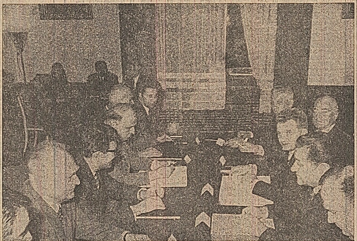
În timpul convorbirilor oficiale

Discuțiile s-au desfășurat într-o atmosferă cordială și prietenească.