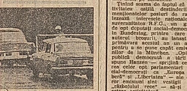
Manila. O imagine caracteristică în aceste zile pe străzile capitalei filipineze: controlul riguros al autovehiculelor, ca urmare a introducerii legii marșiale.

La Congresul de chirurgie din R.D.G., care se desfășoară la Berlin, participă 1.200 oameni de știință din domeniul medicinei din R. D. Germanii și 150 oameni de peste hotare. Din România, participa o delegație condusă de prof.