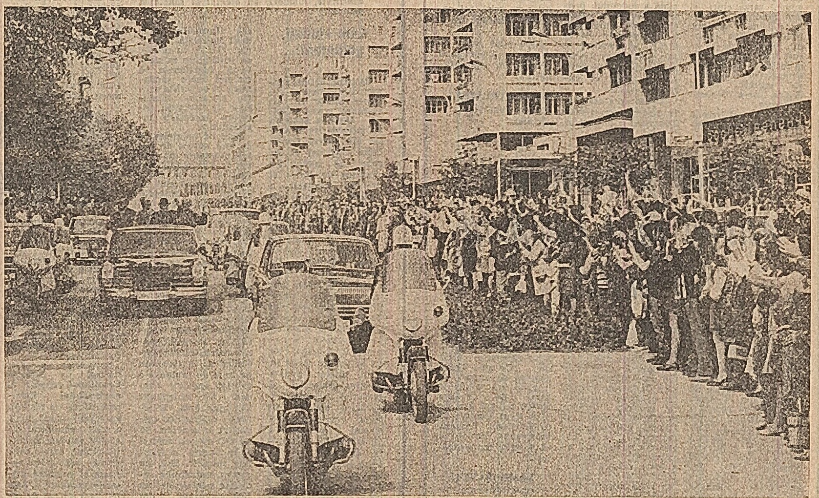
Enthusiastică primire din partea populației orașului Varna

În cinstea aniversării Republicii, comitetul județean pentru cultură și educație socialistă, în colaborare cu organizațiile de tineret și sindicale, a lansat pentru toate căminele culturale, case de cultură, cluburi municipale un concurs muzical-coregrafic, sub titlul generic „Slava României socialiste”. Concursul, organizat pe etape, antrenînd numeroase formații corale, instrumentale și coregrafice, interpretînd muzică populară și cultă, este menit să valorifice mai bine resursele artistice existente în rîndul amatorilor.