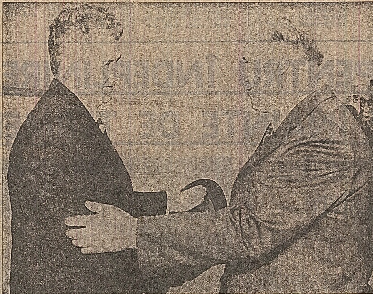
La sosire, pe aeroportul din Varna

Un grup de pionieri a oferit flori secretarului general al partidului, membrilor delegației.