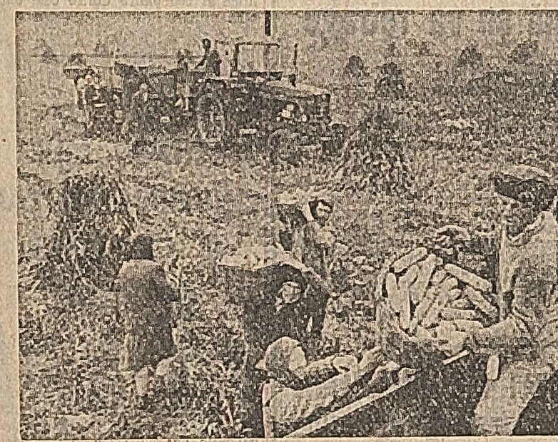
Dis-de-dimineață, înainte de a se ridica ceoia, cooperatorii din Drăghiceni au început transportul porumbului din cimp