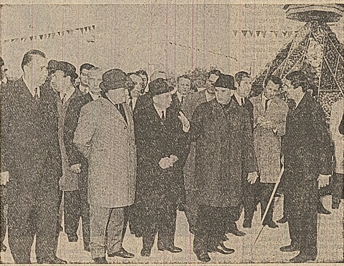
La expoziția agricolă a județului

La intrarea în secția de confecții pentru oșpiți, sînt întâmpinați de un grup de muncitori, care prezintă cu gingășie și grație unele dintre cele mai noi modele din producția fabricii. Tovarășul Nicolae Ceaușescu este informat asupra preocupărilor pentru asigurarea pieței cu cantități cât mai mari de îmbrăcăminte pentru copii și în surmontele lor mai surzete și pliate. În acest scop, colectivul secției folosește de eteva luni cu succes sistemul de lucru silonon, care determină o productivitate sporită față de tehnologiile la bandă și convolor. Secretarul general al partidului apreciază realizările din acest sector și se interesează de perspectiva de