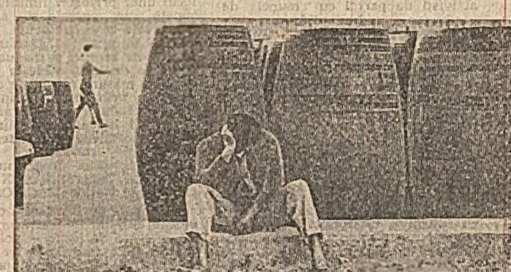
Somer - la periferia Lisabonei și... a societății