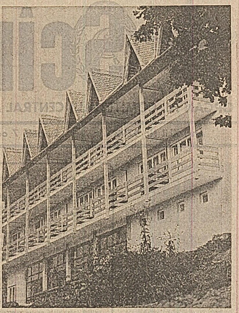
Noul hotel balnear din noua stațiune „Valea Măriei”, din Oaș