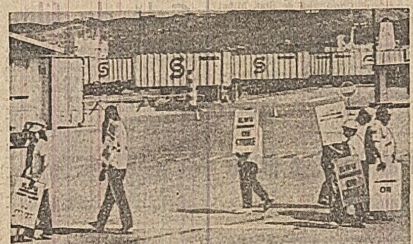
Hawaii. Duminică trecută, docherii au pus pichete în urma disputelor cu compania „Hostedvoring”, asupra contractelor. Astfel, a început prima grevă declanșată în Hawaii, după 23 de ani. În fotografia: pichetele alo docherilor greviști