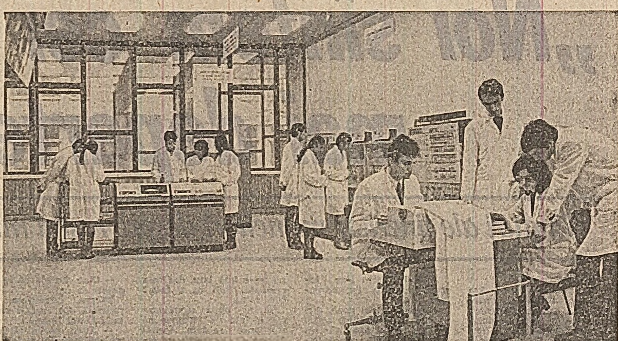
Imbinand activitatea didactica cu cea de cercetare, lectia este mai atragatoare pentru elevii, catredra de cibernetic economic din A.S.E. din Bucuresti...