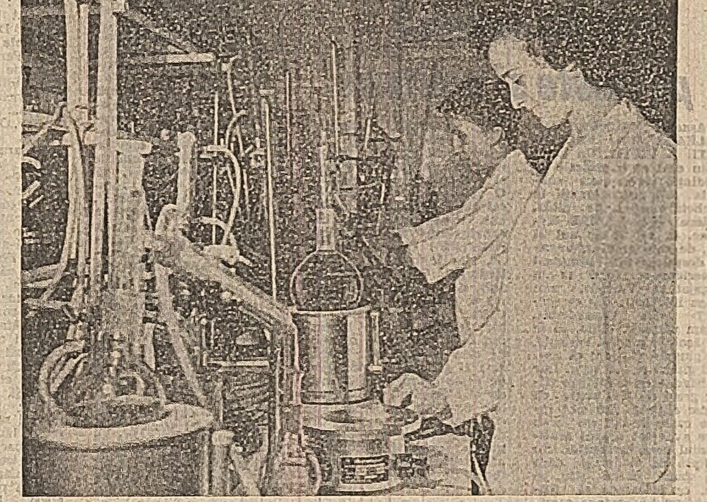
Folosind lupini selecționați de Claviceps purpurea, cu un conținut ridicat de alcaloizi, specialiștii din cadrul Institutului pentru controlul de stat al medicamentului și cercetării farmaceutice din Capitală...