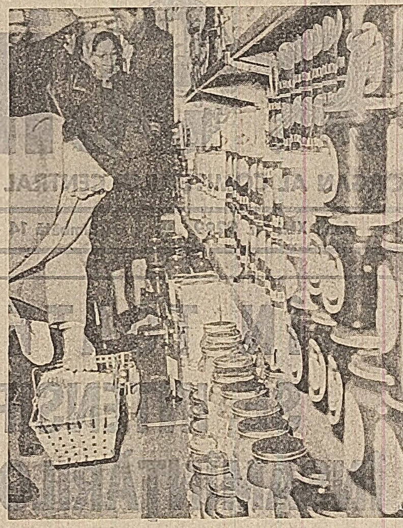
S-a redeschis în Capitală — într-o nouă formă de organizare — magazinul de prezentare a industriei alimentare din str. Beldiman nr. 2. La sectorul de vizitare-prezentare, de la subsool, au fost organizate standuri separate ale centralelor industriale, fiecare unitate expunîndu-și produsele din profilul său.