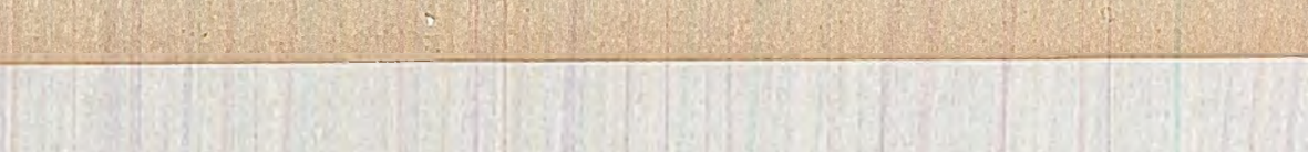
Un fenomen înfrîngător este și creșterea criminalității în țările occidentale...