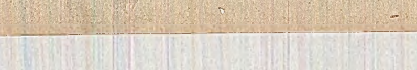
Un fenomen înfrîngător este și creșterea criminalității în țările occidentale...