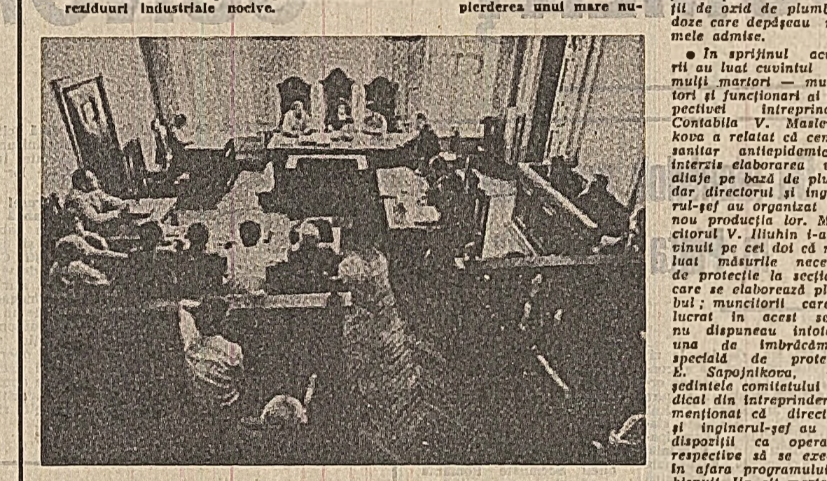
În sala de judecătoare...