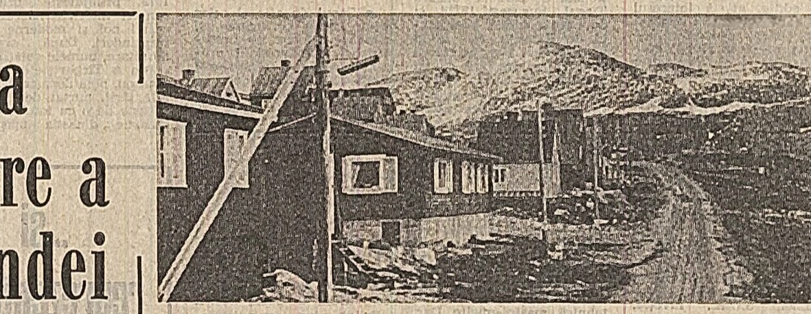
Peisaj din „țara de gheață”