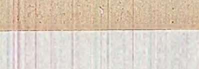
Un fenomen înfrîngător este și creșterea criminalității în țările occidentale...