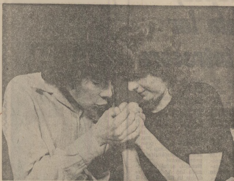
Scenă din spectacolul „Valentin și Valentina”, de Mihail Rogăscu, la Teatrul „Bulandra”. Protagonisti: Mariana Mihuş şi Florian Pittiş