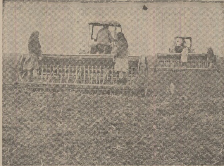
La cooperativa agricolă din Nanov, județul Teleorman, fiecare oră bună de lucru este folosită pentru însășișingurii grâului

Duminică, aproximativ 15 000 muncitori, funcționari și elevi din Alba Iulia, Ocna Mureș, Aiud, Cugir, Baia și Sebeș au ajutat pe lucrătorii ogoarelor la recoltatul porumbului. Au mai rămas de recolat aproximativ 9 000 ha de porumb. Ziua de ieri a însemnat practic încheierea recoltatului la cartofi și stecă de zahăr. La I.A.S. Alba Iulia, salariații muncitorilor și elevii au recoltat până în prezent aproximativ 1 000 hectare porumb. În multe locuri, la culeșul porumbului participă toți lucrătorii satelor. În cooperativă agricole din Gălda de Jos, Vințu de Jos, Mihăil, Unirea, Șona, Jidvei s-a recolat și transportat recolta de pe sute de hectare cu porumb. Partea s-a muncit la pregătirea terenului și însămânțatul grâului, lucrare care până în prezent a fost executată în proporție de 90 la sută. Tot ieri au fost transportate la bazele de recepție mii de tone de porumb, stecă de zahăr și cartofi.