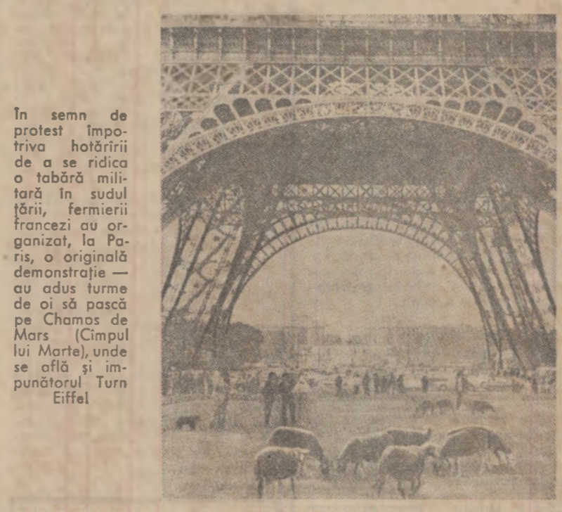
În semn de protest împotriva hotărârii de a se ridica o tabără militară în sudul țării, fermierii francezi au organizat, la Paris, o originală demonstrație — au adus ferme de oi să poască pe Champs de Mars (Cîmpul lui Marte), unde se află și impunătorul Turn Eiffel.

LIMA 4 (Agerpres). — Centrul de greutate al relațiilor interamericane trebuie deplasat spre o cooperare economică, înțelegând în mod real, și spre apărarea comună a intereselor sociale și economice ale popoarelor noastre — a declarat ministrul peruan al afacerilor externe, Miguel Angel de la Flor Valle, cu ocazia vizitei omologului său ecvadorian. El s-a pronunțat hotărât pentru reevaluarea actualului sistem interamerican, menționând că solidaritatea continentală, în timpurile noastre, înseamnă dezvoltarea cu prioritate a relațiilor economice în folosul propriilor popoare.