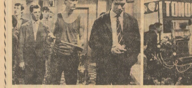
(Urmare din pag. 1)

Producție a studioului Jadran Film — Zagreb. Regia: Franko Bauer. Cu: Boris Dvornik, Jjubica Jovic, Branko Reis