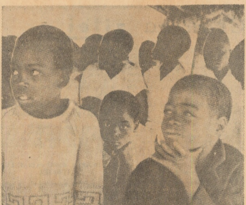
În zonele eliberate din Mozambic au fost create 160 de școli în care învață 20.000 de copii. Sub conducerea Frontului Național de Eliberare se desfășoară, de asemenea, o amplă campanie de lichidare a analfabetismului în rândul populației adulte

de a paraliza viața economică și politică și nu au permis elementelor de dreapta să-și atingă scopurile. Secretarul general al P.C. din Chile a precizat că militarii au intrat în guvernul Alianței urmărind un obiectiv concret — de a pune capăt acțiunilor forțelor de dreapta, de a contribui la transformările social-economice care se înfăptuiesc în țară și de a nu permite ca viitoarele alegeri parlamentare, din martie 1973, să ducă la un război civil, așa cum intenționează reacțiunea internă și externă.