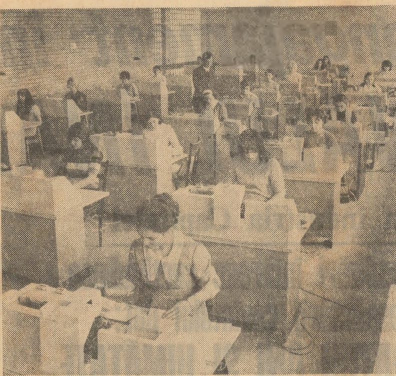
Imagine de la Centrul teritorial de calcul din Ploiești

Opinia potrivit căreia arela sonoră ni se derulează spontan și pasiv, fără școală și fără eforturi organizate, este o eroare rezultînd din necunoașterea lucrurilor. Muzica se studiază ca orice alt domeniu al realizării omenirii, se adresează în tot timpul și sub cele mai diferite forme, de la cele direct pedagogice la cele specifice, esențialmente artistice. Desigur, cea mai adecvată, cea mai sensibilă la ecloența muzicii este vîrstă