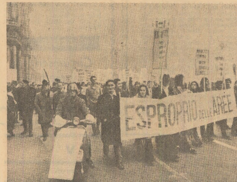
Italia. Muncitori constructori demonstrând la Milano pentru condiții mai bune de muncă și viață

BERLIN 20 (Agerpres). - Republica Democrată Germană a adresat Organizației Națiunilor Unite pentru Educație și Cultură (UNESCO) cererea de a fi primită ca membră a acestei organizații - a anunțat agenția A.D.N. Cererea a fost exprimată într-o scrisoare adresată de Otto Winzer, ministrul Afacerilor Externe al R.D.G. secretarului general al UNESCO, René Maheu.