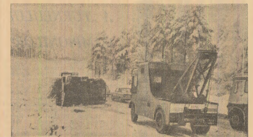
În sudul și sud-vestul Angliei s-au înregistrat căderi de zăpadă care au perturbat serios circulația. În fotografie: pe o șosea din apropierea orașului Exeter

Georges Pompidou, împreună cu soția, a sosit luni la Ouagadougou pentru o vizită oficială de două zile în Volta Superioară.