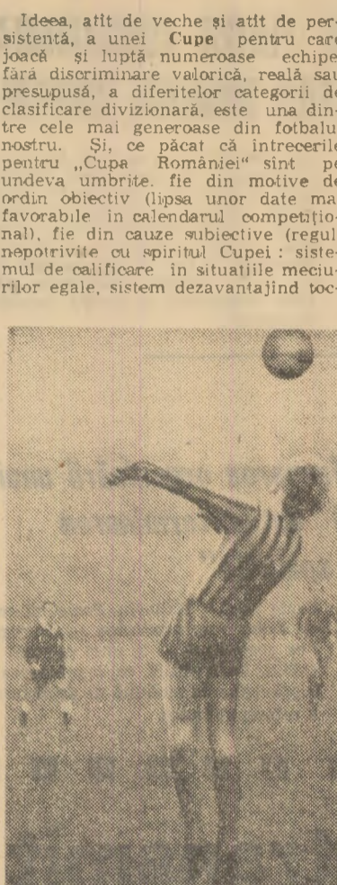
Fotbalul se joacă și... cu capul (fază din meciul Progresul-Petrolul)

Ideea, atât de veche și atât de persistentă, a unei Cupe pentru care joacă și luptă numeroase echipe, fără discriminare valorică, reală sau presupusă, a diferitelor categorii de clasificare divizionară, este una dintre cele mai generoase din fotbalul nostru. Și, ce păcat că întrecerile pentru „Cupa României” sînt pe undeva umbrite, fie din motive de ordin obiectiv (lipsa unor date mai favorabile în calendarul competițional), fie din cauze subiective (reguli nepotrivite cu spiritul Cupei; sisteme de calificare în situațiile meciurilor egale, sistem dezvoltant în jocul echipei din categoriile inferioare - partidele pe terenuri „neutre”). Ieri ne-a fost dat să înregistrăm obișnuita serie de surprize, rezultate și surorii mai puțin șocante, ambele izvorcite din dorința echipelor „mici” de a învinge pe cele „mari”, din ambiția anonimilor de a „iesi la suprafață” fotbalului național. Acestui elan de autodefapere i-au căzut victime în etapa XVI-lor, nu mai puțin de cinci echipe din divizia A, alte cinci calificându-se, la scor egal, prin acea clauză de penitențe despre care am lămurit mai sus! Iar, printre cei favorizați de către asemenea soar-