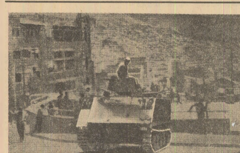
Tancuri patrulînd pe străzile din La Paz. O imagine frecventă în aceste zile în capitala boliviană, după decretarea de către guvern a stării de urgență, ca răspuns la intensificarea mișcărilor de protest ale maselor populare din această țară

Lunii; detectarea razeilor cosmice care lovesc suprafața selenară și modifică natura chimică a solului lunar; numeroase fotografii și observații astronomice. Astronauții vor depune mici explozive la 3,5 kilometri de locul de aterizare care vor fi declanșate cu ajutorul semnalelor radio de pe Pămînt. Vor fi recoltate 100 de kg de rocă lunară, cantitate care va ajuta, probabil, la definirea unui răspuns la întrebarea fundamentală privind originea Lunii și a sistemului solar. Totodată, va fi instalat un al șaselea laborator științific care va transforma satelitul Pămîntului într-un laborator „comunicativ”.