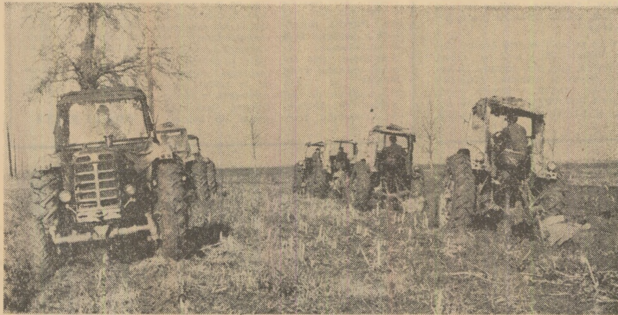
Mecanizatorii de la Stațiunea pentru mecanizarea agriculturii Tîrziușești, județul Ilfov, folosesc din plin timpul bun de lucru pentru executarea arăturilor de toamnă