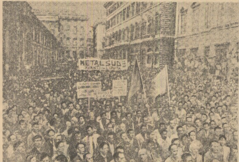
ROMA. Amplă demonstrație a muncitorilor din industria metalurgică în sprijinul satisfacerii revendicărilor lor economice și sociale