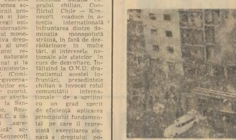
După cum s-a anunțat, săptămîna trecută, într-o clădire cu șase etaje din Roma, a avut loc o explozie violentă — soldată cu 65 de răniți și 15 morți — ca urmare a depozitării ilegale de prof de pușcă, în scopul fabricării de artilerie pentru apropiatele sărbători de iarnă. În fotografie: imaginea de la locul catastrofei

Doi avioane militare americane s-au ciocnit marți seara în zbor deasupra statului Carolina de Sud. Cel doi aparate un „C-130”, care transporta 12 persoane și un avion de luptă „F-012” având la bord doar pilotul, s-au dezechinat în aer. Pînă în prezent nu a fost descoperit nici un supraviețuitor.