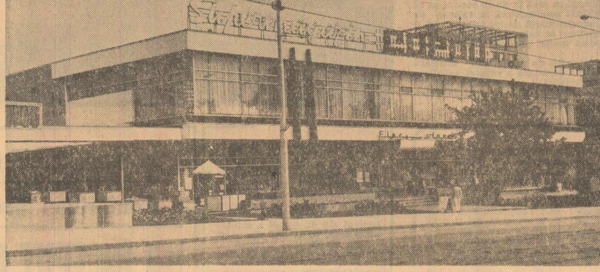
Supermagazinul „Copou” din Iaşi

Unitate importantă a industriei usoare. Fabrica de confecţii din Bacău a devenit cunoscută numeroşilor beneficiari interni si externi datorită diversităţii si calităţii produselor pe care le realizează. Singurul mai solicitat uniformele scolare, confecţiile pentru copii si adulţi, precum si costumele de protecţie destinate muncitorilor din industria siderurgică realizate de fabrica bacăuană. Colexistă în această fabrică a livrat de la începutul anului si pînă acum o producţie suplimentară în valoare de peste 17 milioane lei. Acest spor se datorează si născut muncitorilor, inginerilor si tehnicienilor de aici, creşterii productivităţii muncii, eficienţei organizării a fluxurilor tehnologice. În prezent, colec-