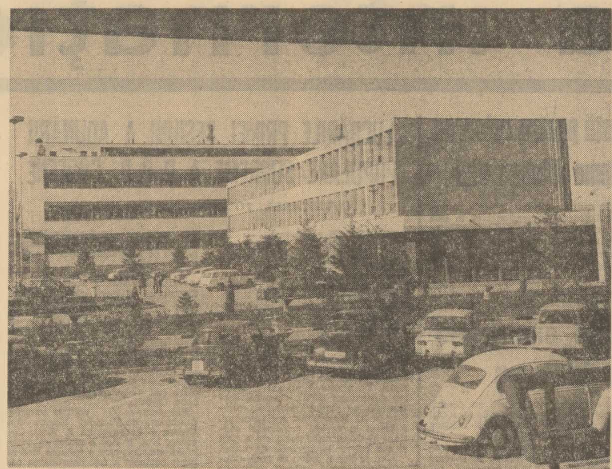
Institutul de cercetări chimice din zona industrială Dudești a Capitalei

Comandamentul aviației civile TAROM informează că în zilele zilei 1 și 2 ianuarie sînt suspendate toate cursurile interne. In ziua de 31 decembrie, de pe aeroportul internațional Otopeni vor decola aeronave cu întoarcerea în acoasă și pe direcțiile care iesesc din țară: spre orașele Frankfurt pe Main, Paris, Budapesta, Varsovia, Praga, Berlin, Zürich și Viena. Cunoscindeu se solicitările reduse, în prima zi a anului nu se va efectua nici o cursă externă. Marți, 2 ianuarie, se organizează zboruri directe din București spre Atena, Cairo, Viena, Zürich, Roma și Paris. (Agerpres)