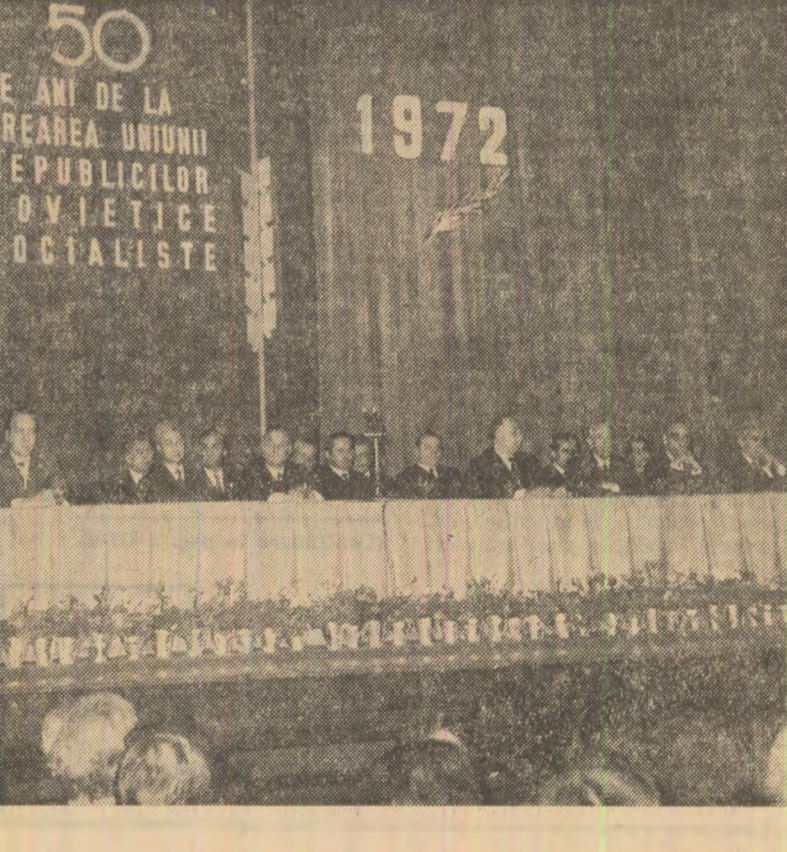
50 DE ANI DE LA CREAREA UNIUNII REPUBLICILOR SOVIETICE SOCIALISTE 1972

Străduindu-se să înfăptuiască indicaţiile secretarului general al partidului, ca fiecare ramură industrială să-şi asigure cu forţe proprii o parte din maşinile, utilajele şi piese de schimb, unităţile specializate ale Ministerului Industriei Uoare asigură în prezent mai mult de 80 la sută din necesarul de instalaţii şi maşini pentru dotarea fabricilor din acest sector al economiei naţionale, economisind în acest fel importante sume valutare.