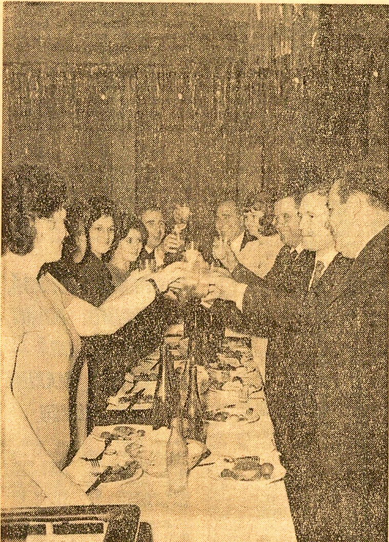
In clipa care desparte anul '72 de anul '73, colectivul uzinelor „23 August“ din Capitală toastează, deopotrivă, pentru rodnicia anului care se încheie, pentru realizările anului ce începe...