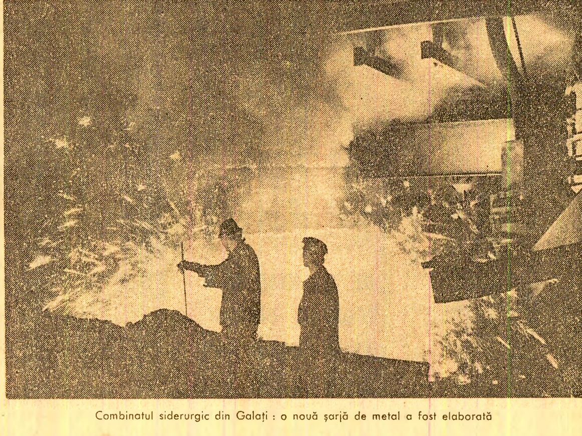
Combinatul siderurgic din Galați: o nouă sarjă de metal a fost elaborată