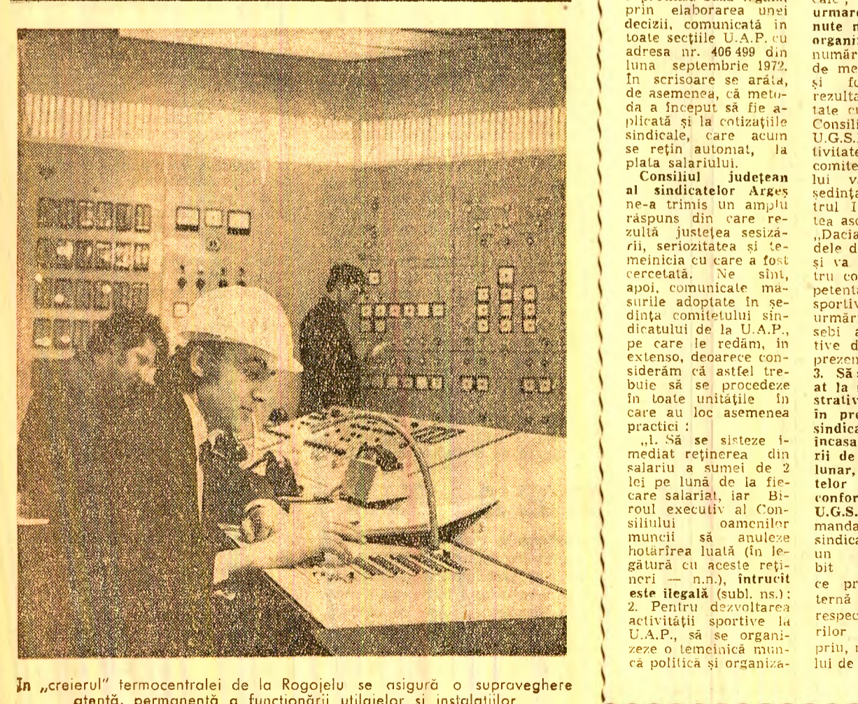
În «creierul» termocentralei de la Rogojelu se asigură o supraveghere atentă...