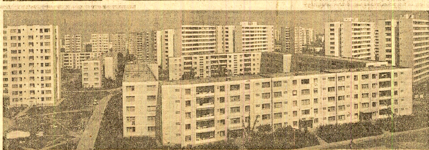
Imagine din cartierul bucureștean Berceni

Zoe VASILIU profesor strada Colectorului nr. 29 - București, sectorul 5