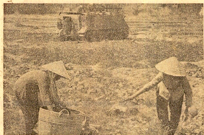
În aceste zile, într-o din zonele aflate sub controlul forțelor patriotice din Vietnamul de sud. După semnarea Acordului de încetare a războiului și restabilirea a păcii în Vietnam, locuitorii satelor se întorc la munca câmpului