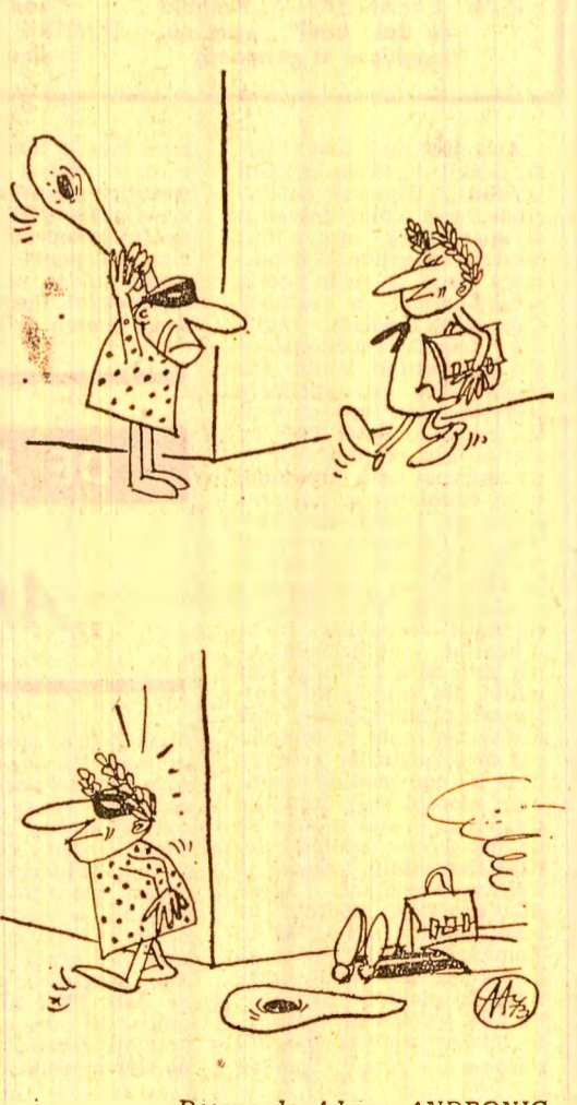
Desene de Adrian ANDRONIC