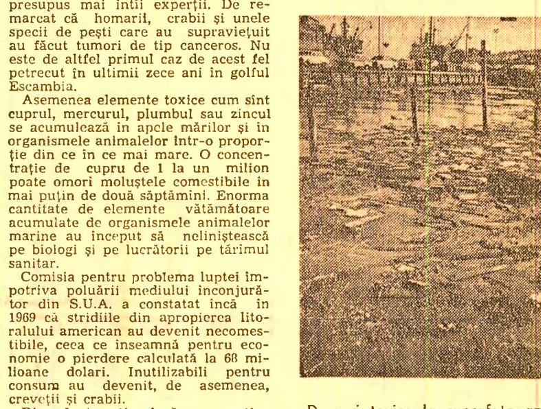
Deșuri toxice la suprafața apei