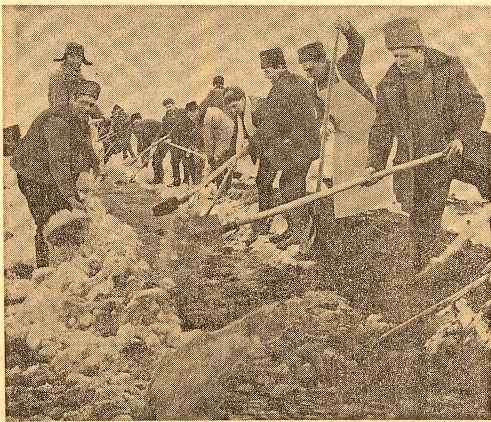
Obstacolele din calea apei au fost înlăturate. Poate curge liniștită. Pentru aceasta, în comuna Girbovi, județul Ilfov, a fost nevoie de intervenția a sute de oameni

Apa provenită din topirea zăpezilor afectează mari suprafețe de teren, îndeosebi în cimpia din sudul țării, unde precipitațiile au fost mai abundente. Din datele comunicate de Institutul de meteorologie și hidrologie rezultă că în cimpia Bărăganului, îndeosebi în bazinele Argeș, Ialomița, Buzău, Călărași, și în partea de nord a județului Ilfov, excesul de umiditate este de 1.500-2.000 mc la hectar, iar pinza freatică variază de la 5 la 50 cm adâncime. Tot în Bărăgan, precum și în lunca Dunării, există terenuri cu bălțiri generalizate, în care excesul de apă este de 1.000-1.500 mc la hectar, iar nivelul freatic este cuprins frecvent între 0,5 și 3 m.