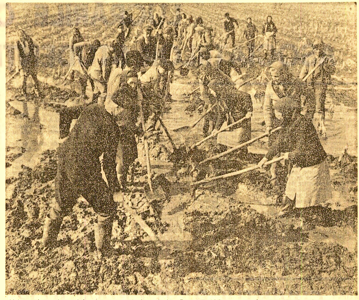
Aici, ca și pe alte tarle ale cooperativei agricole Drăgănești-Vlașca, sute de cooperatori acționează energetic pentru scurgerea apelor și zvintarea mai rapidă a terenului...

LA UZINA „INDEPENDENȚA” DIN SIBIU (secția cazangerie) se execută subsansemblul pentru hidrocentrala Someș — Mărișelu