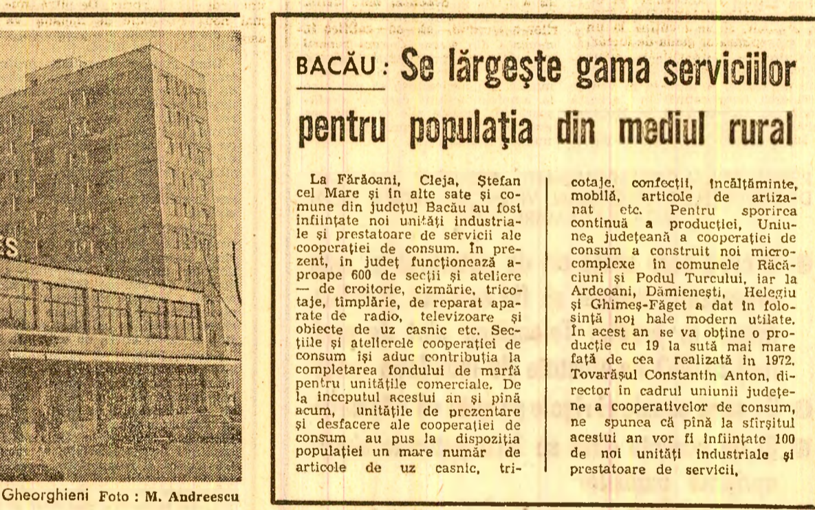
„Hermes“ — un nou și modern complex comercial al Clujului, situat în microraionul IV din cartierul Gheorghieni

Asupra conținutului proiectului de Lege cu privire la înființarea, organizarea și funcționarea Curții Superioare de Control Financiar