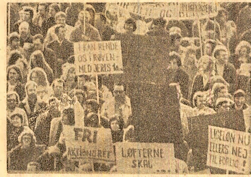
O demonstrație a muncitorilor danezi, pe străzile din Copenhaga

BONN 30 (Agerpres). — Agenția A.D.N. informează că, la 28 și 29 martie, a avut loc în Bonn cea de-a treia sesiune a Comisiei de frontieră a Impuneriilor Germaniei Republicii Democratice Germaniei. A fost prezentat un raport al grupului de lucru pentru marcarea frontierei, constituit la 15-16 martie 1973, și au fost stabilite principiile pentru elaborarea sarcinilor și modulul de lucru ale acestui grup. Comisia de frontieră a purtat convorbiri de lucru intensive în legătură cu probleme practice legate de marcarea frontierei ca, de pildă, reglementarea problemelor economice apărute pe granițele care constituie zone de graniță. Următoarea sesiune a comisiei va avea loc la 3 și 4 mai la Berlin.