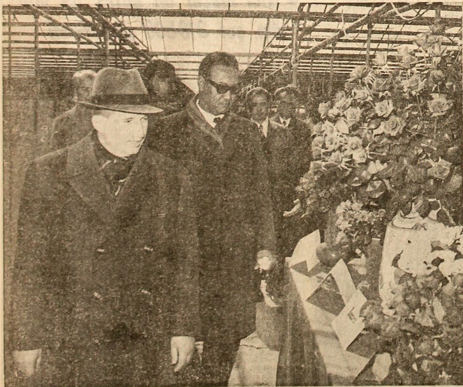
In serele de la Codlea