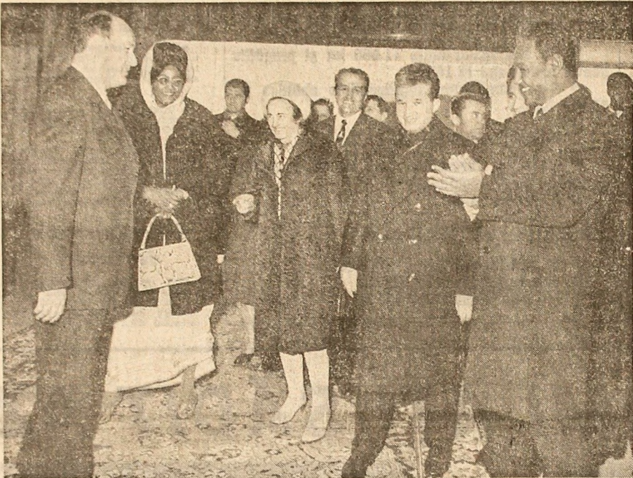
In timpul vizitei la uzina de tractoare

• Pretutindeni, primire caldă, prietenească