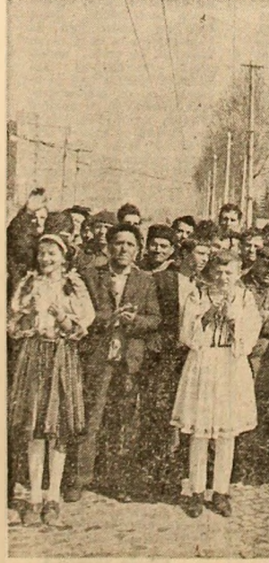
Manifestație de caldă simpatie pe străzile Brașovului

Președintele Gaafar Mohammed Nimeiri, ceilalți oaspeți, se îndreaptă spre orașul Codlea.