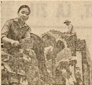
La Hanouai, pe unul din șantierele reconstrucției

Ha, Hai Hung și din regiunea Hanouului se bucură de asistența unor brigăzi tehnice specializate, la care concurează cîteva ministere și ramuri industriale și din care fac parte ingineri, staționiști, topografiști, specialiști în hidrologie și hidrologie, agronomi, biologi etc.