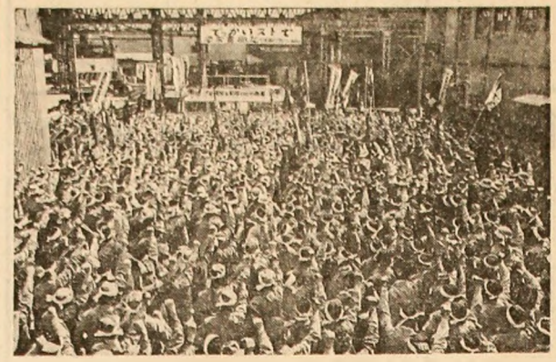
Oamenii muncii din Japonia au început tradițional „ofensivă de primăvară”, în cadrul căreia sînt organizate, în fiecare an, ample acțiuni în sprijinul revendicărilor privind îmbunătățirea condițiilor de muncă și de trai. În imagine: aspect de la un miting al muncitorilor metalurgiști care a avut loc, zilele trecute, la o uzină din Tokio

Aceste propuneri își găsesc un larg sprijin în rândurile organizației. Astfel, George Moo, președintele provizoriu al Adunării Generale a O.S.A., ministrul al afacerilor externe al insulelor Barbados, sublinia,