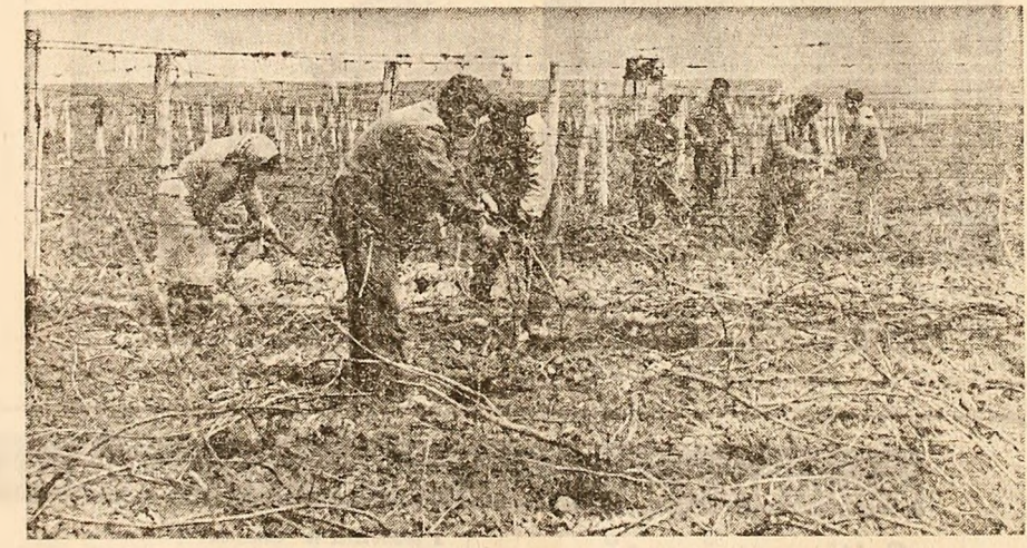
Se pregătește viitoarea recoltă de struguri la cooperativa agricolă Niculițel, județul Tulcea

Din ultima situație operativă aflată la Direcția agricolă a județului Suceava rezultă că în multe cooperative agricole, între care cele din Bilca, Frătăuții Noi, Vicov de Jos, Grănciști și altele, n-a început încă sortarea cartofilor de sămînță. Ce-i drept, tenențele unităților menționate nu s-au zădărnicit pentru a permite începerea lucrărilor de plantare. Dar tot atât de adevărat este și faptul că sortarea putea fi încheiată. Nu putem să nu adresăm președinților și inginerilor agronomi din unitățile amintite întrebarea: cînd începeți sortarea cartofilor?